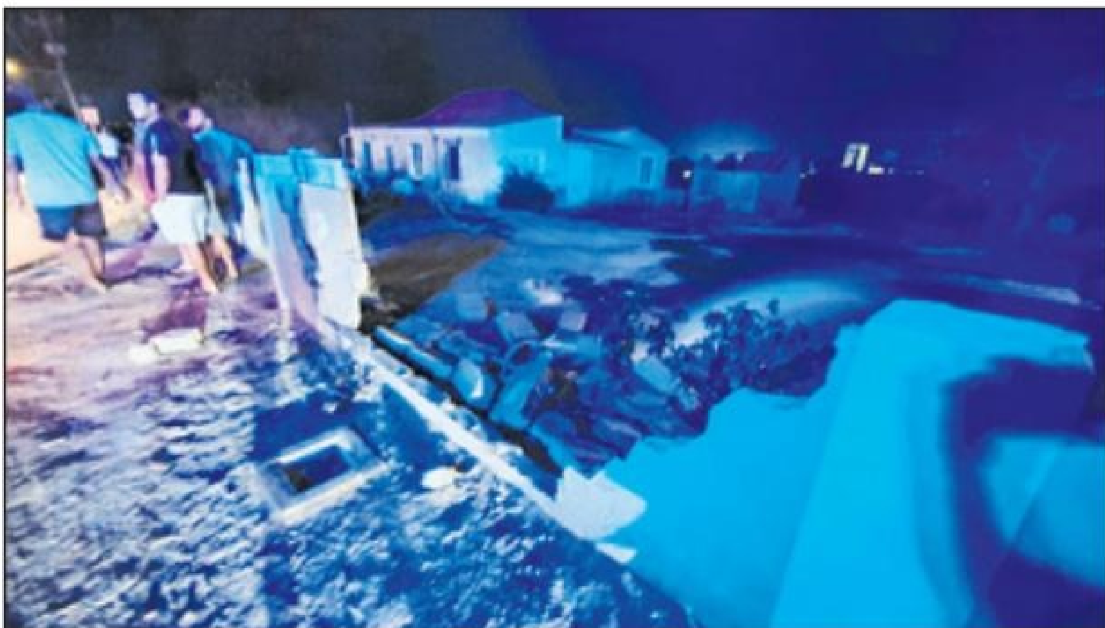
Diahuebs marduga a drenta informe di un accidente basta pisa y cu hende herida riba e caminda di Seroe Biento pa Hooiberg, mesora a dirigi tanto polis